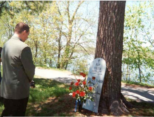
Stéphane Bergeron se recueillant sur le lieu de sépulture de ses ancêtres.