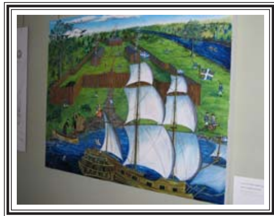
Peinture de Marilyn Mazerolle