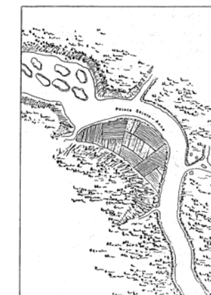
Section de la carte de John Marr montrant les terres en culture à la Pointe-Sainte-Anne

Les Acadiens de la Pointe Sainte-Anne avaient entre 600 et 700 acres de terre en culture. Une carte de John Marr dressée en 1764 nous montre l'étendue du village et des terres en culture qui incluait toute la