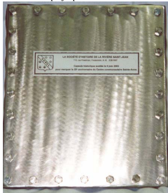
LA SOCIÉTÉ D'HISTOIRE DE LA RIVIÈRE SAINT-JEAN 715, rue Priestman, Fredericton, N.-B. E3B 5W7